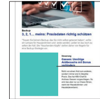
Newsletter Native ad