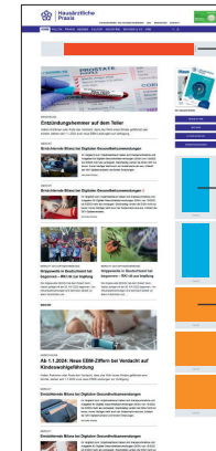
IAB Large Leaderboard*